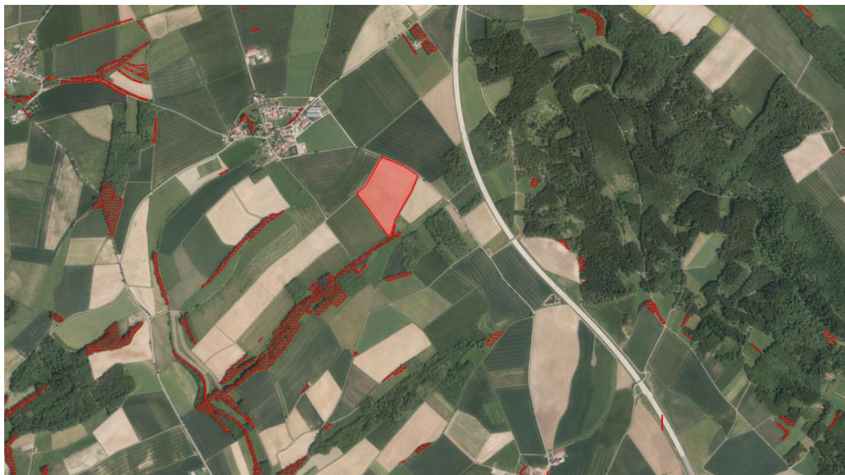
Abbildung 1: Auszug aus Biotopkartierung

Es werden keine Flächen nach ABSP oder Biotopkartierung überplant. Kartierte Biotope stehen nicht in funktionellem Zusammenhang mit den überplanten Flächen.