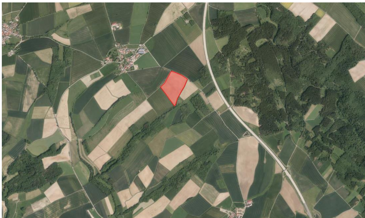
Landschaftsbild - rot: Geltungsbereich der Bauleitplanung;

Westlich des Geltungsbereiches befindet sich in ca. 450 Meter Entfernung Mirsdorf. Durch die gute Eingrünung dieser Ortschaft ist eine Einsicht auf das Planungsgebiet relativ gering aus dieser Richtung. Sichtachsen zu anderen Siedlungsbereichen bestehen nicht.